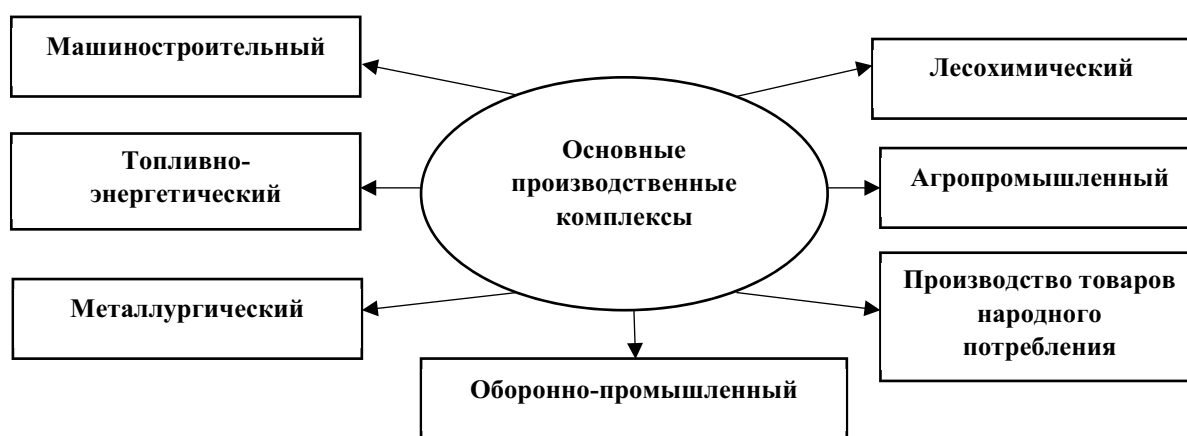
Рис. 3. Основные производственные комплексы