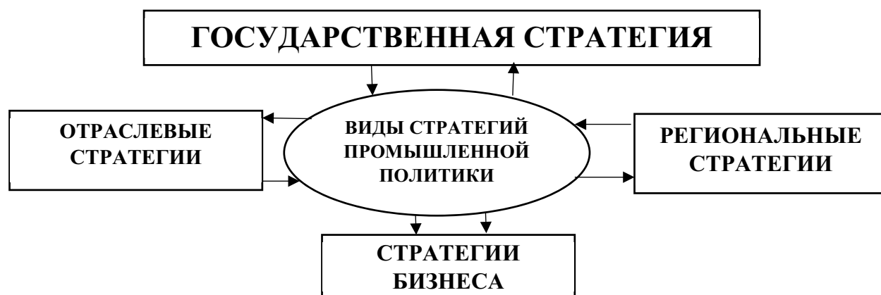
Рис. 2. Государственная стратегия промышленной политики