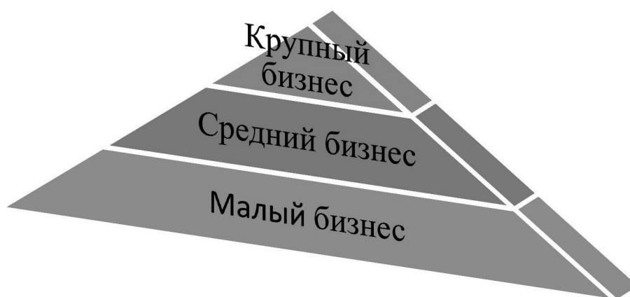
Рис. 5. Пирамида бизнеса в России