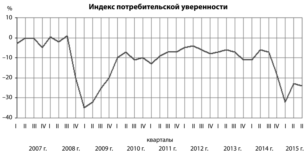
Рис. 2. Динамика индекса потребительской уверенности за 2007–2015 гг.