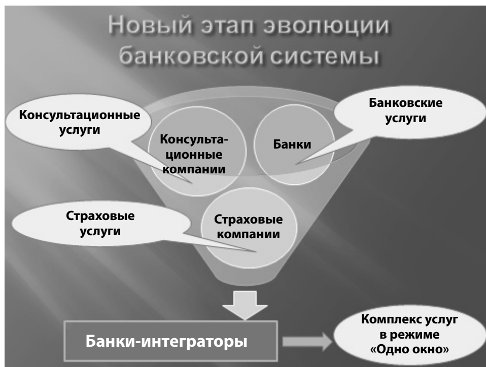
Рис. 3. Создание банков-интеграторов

У банков нет другого пути — им жизненно необходимо осваивать сферы деятельности, не связанные напрямую с их основным профилем, так как процентный доход от кредитования перестал быть основным источником прибыли. Нарращивать клиентскую базу высокими темпами тоже не получится: так или иначе она распределена. Выход видится в увеличении доходов за счет роста проникновения банковских услуг, развития нефинансового сотрудничества. Возможно, это новый этап эволюции банковской