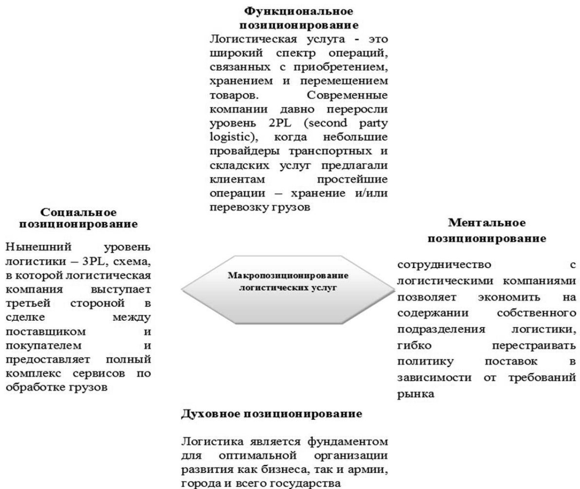
Рис. 2. Позиционирование рынка логистических услуг

К «жестким» атрибутам логистических услуг можно отнести время доставки, качество автотранспорта, пропускную способность, месторасположение компании, подходы и подъезды к ней, надежное, современное, эргономичное оборудование и средства производства, современные, сертифицированные процедуры и технологии, время работы, доступность и полноту информации о компании и ее услугах, комплексность услуги. Данные атрибуты, используемые практически всеми логистическими компаниями, имеют коммодитизированный характер, поэтому рекомендуется обращать внимание на «мягкие» атрибуты позиционирования, переводя их в «жесткие», по которым потребители смогут