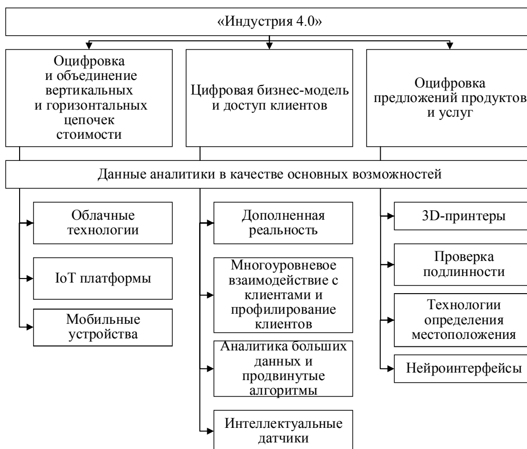
Рис. 1 / Fig. 1. Инструменты цифровой экономики в промышленности / The tools of the digital economy in the industry